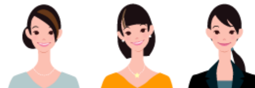
主任ケアマネジャー 社会福祉士 保健師