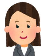
主任介護支援専門員