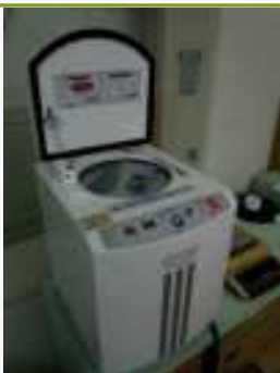
軟膏を混ぜる機械もあります♪