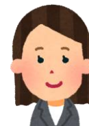
主任介護支援専門員